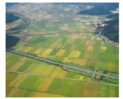
韓国最大の穀倉地帯； キムジェマンギョン (金堤萬頃) 平野